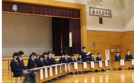
4/25 生徒総会で委員会案承認