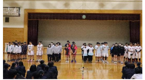
4/30 総体壮行会で各部が決意表明