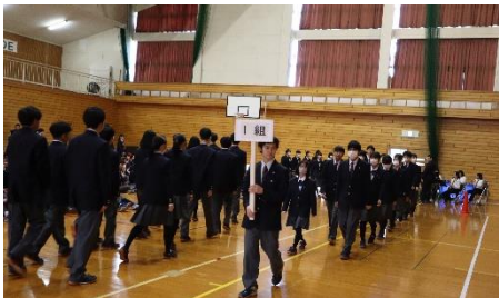
4/10 対面式での1年生入場