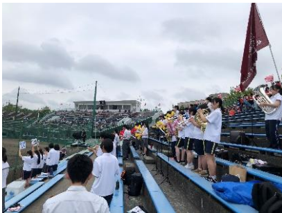
← 7/8 野球応援 VS 大館桂桜 2-6 で惜敗